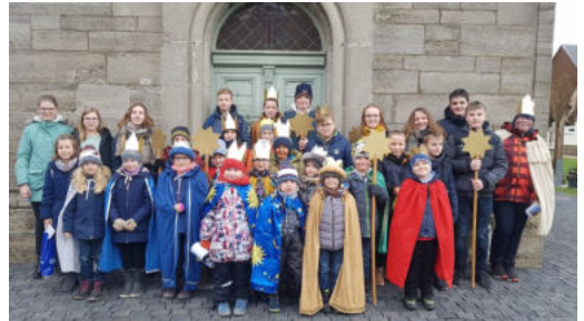
Sternsinger in Büttstedt