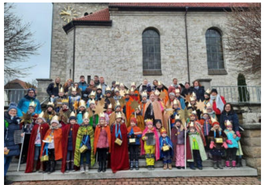
Sternsinger in Bickenriede

Vom 5. - 7.12.2019 war eine Gruppe Kinder aus Mukaschevo/ Ukraine zu Gast in unserer Pfarrei. In der Kirche in Wachstedt führten sie ein weihnachtliches Spiel mit Tänzen und Gesängen auf und auch der Nikolaus kam zu Besuch.