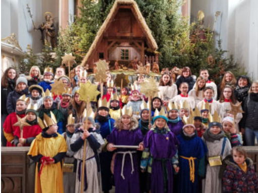
Sternsinger in Küllstedt

Unser herzlicher Dank gilt den Sternsängern, den Jugendlichen und Erwachsenen, die sich um die Sternsinger gekümmert haben, allen, die die Aktion vorbereitet und organisiert haben und allen Spendern.