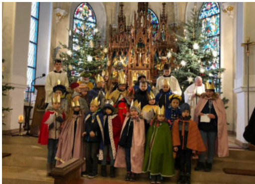
Sternsinger in Wachstedt