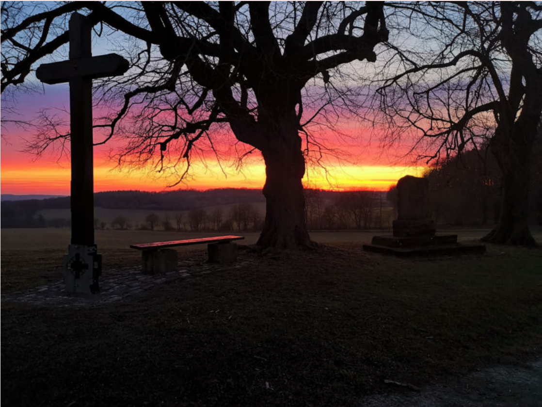
Madeberg in Küllstedt