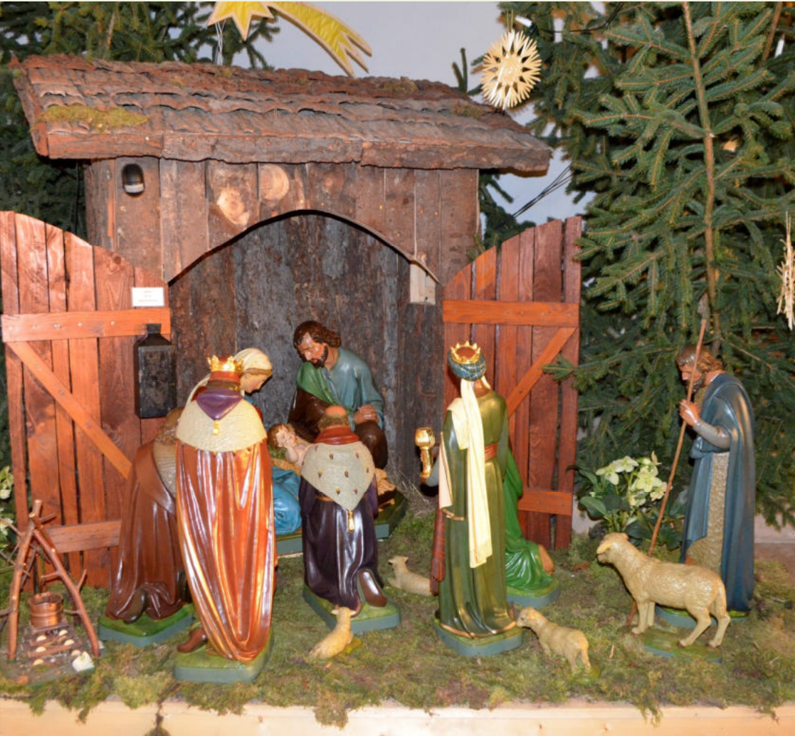
Krippe - Kirche St. Michael / Wachstedt

Katholische Pfarrgemeinde „St. Georg und Juliana“